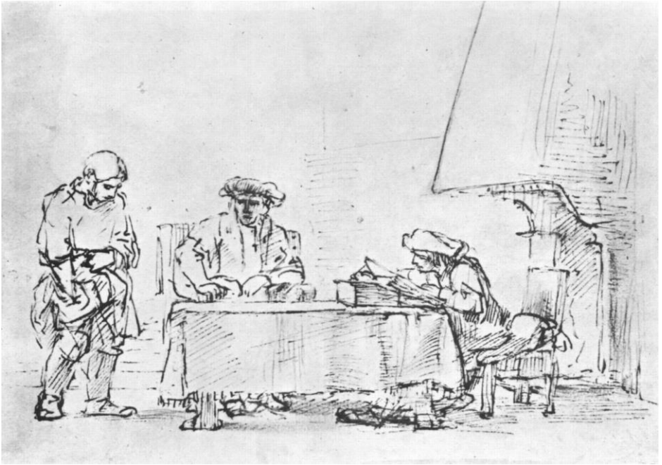
Gelijkenis van de talenten van Rembrandt Harmenszoon van Rijn (1606-1666)